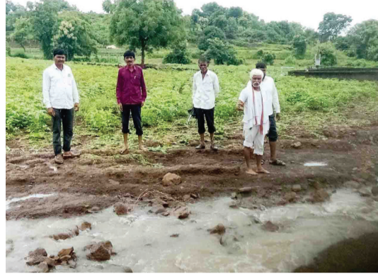
देवानगर किनावा जवू सह परिसरात ढगफुटी सदृश्य पाऊस पडला पडलेल्या या अवकाळी पावसामुळे भुमराळा

भुमराळा : दि. २२ जुलै रोजीच्या सकाळी ३ ते ४ वाजेदरम्यान लोणार तालुक्यातील अनेक गावांत मुसळधार तर अनेक ठिकाणी ढग फुटी सदृश्य पाऊस पडला यामध्ये असंख्य शेतकऱ्यांचे नुकसान झाले असून सदर नुकसानीचे त्वरित पंचनामे करून नुकसान भरपाई देण्याची मागणी शेतकरी करीत आहे आज सकाळी भुमराळा सावरगाव तेथील