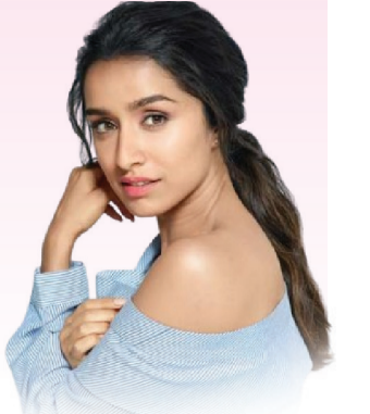
श्रद्धा कपूरही अहान पांडेची फॅन, तिच्या 'सैयारा' सोबत गाठलं थिएटर