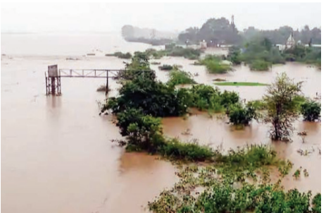
असून आज (२३ जुलै) संपूर्ण विदर्भ व मराठवाड्यात पावसाचा यलो अलर्ट देण्यात आला आहे. पूर्वेकडील विदर्भातही आज पावसाचा जोर कायम राहणार असून पुढील चार दिवस विदर्भात तीव्र इशारे देण्यात आले आहेत. मराठवाडा व विदर्भात पावसाचा जोर पुढील चार दिवसांत वाढणार असून पावसाच्या जोरदार सर्रांची हजेरी लागेल असही हवामान खात्यानं सांगितलंय.