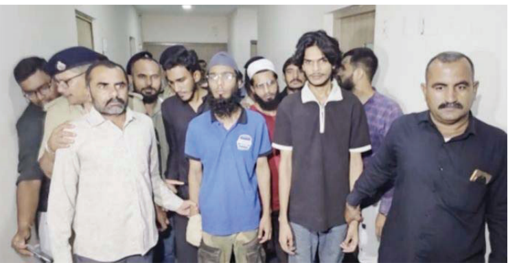
गुजरात एटीएसला त्यांच्या काही सोशल मीडिया हँडल्स आणि चॅट्स

चौकशी केली जात आहे. एटीएसच्या अधिकाऱ्यांनी दिलेल्या माहितीनुसार, हे चौघेही दीर्घकाळापासून अल-कायदा मॉड्यूलशी जोडलेले होते. ते सोशल मीडियाच्या माध्यमातून एकमेकांच्या संपर्कात आले होते. काही गटांमध्येही सक्रिय होते. तपासादरम्यान, एटीएस पथकाला असे आढळून आले की, हे चारही जण गुजरातमध्ये होणाऱ्या संभाव्य दहशतवादी कारवायांबद्दल सतत चर्चा करत होते. याच संदर्भात त्यांना अटक करण्यात आली आहे.