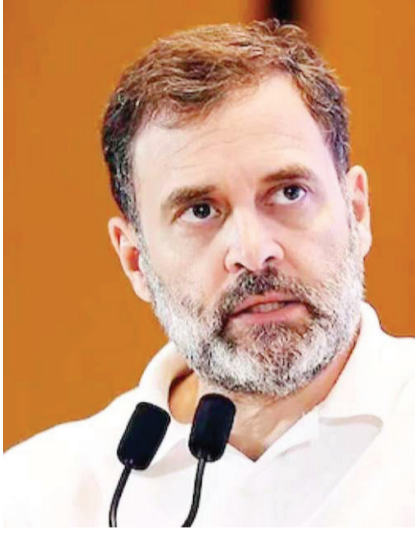
अगदी ब्लॅक अँड व्हाईट पुरावे आमच्या हातात आहेत.

नवी दिल्ली : लोकसभेतील विरोधी पक्षनेते राहुल गांधी यांनी पुन्हा एकदा महाराष्ट्रातील निवडणूकांवरून टीका करत डगले आहे. महाराष्ट्रातील निवडणूक भाजपने मतांचा घोळ करून जिंकल्या, असा पुनरुच्चार राहुल गांधींनी केला आहे. मतांमध्ये घोळ कसा केला जातो, याचे पुरावे हाती लावल्याचेही त्यांनी सांगितले. तसेच याबाबत निवडणूक आयोगाकडे पुराव्यांसह सादरीकरण करणार असल्याचेही राहुल गांधी यांनी स्पष्ट केले. महाराष्ट्रात एक कोटी नवीन मतदार दिसून आले. त्यांच्याद्वारे भाजपने मतांचा घोळ करून महाराष्ट्रातील निवडणूक जिंकली. कर्नाटकात आम्ही ही चोरी पकडली आहे. मी तुम्हाला, इलेक्शन कमिशनला हे अगदी ब्लॅक अँड व्हाईट रूपात स्पष्टपणे ही मतचोरी कशी होते ते दाखवून देऊ. आमच्या हातात पुरावे आहेत. त्यांनाही ते कळून चुकले आहे की ही चोरी आमच्या लक्षात आली आहे. कर्नाटक निवडणूकीतील