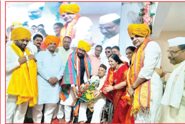
सत्कार करताना ना. श्री. प्रतापराव जाधव मंत्री आयुष (स्वातंत्र प्रभार) आरोग्य व कुटुंब कल्याण राज्यमंत्री भारत सरकार