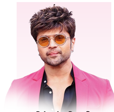
हिमेरा रेसमियाची मराठी संगीत-सिनेसुधीत दमदार एन्ट्री!