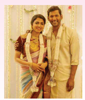
४८ वर्षीय तमिळ अभिनेता विराल अन् अभिनेत्री साई धनशिकाचा सारवरपुडा संपन्न