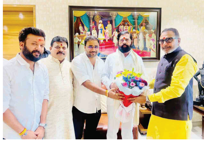
एकनाथजी शिंदे यांची ठाणे येथील निवासस्थानी जाऊन सदृच्छा

बुलढाणा/प्रतिनिधी: शिवसेनेचे मुख्यनेते एकनाथराव शिंदे त्यांच्या ठाणे येथील निवासस्थानी जाऊन केंद्रीयमंत्री प्रतापराव जाधव यांनी आज सदृच्छा भेट घेतली. तसेच लालबागचा राजा श्री गणेशाचे मनोभावे दर्शन घेऊन सर्व जनतेला चांगले निरोगी आयुष्य दे असे साकडे घातले. केंद्रीय आयुष्य (स्वतंत्र प्रभार) आरोग्य व कुटुंब कल्याण राज्यमंत्री प्रतापराव जाधव हे २ सप्टेंबरला मुंबई दौऱ्यावर असताना त्यांनी शिवसेनेचे मुख्यनेते