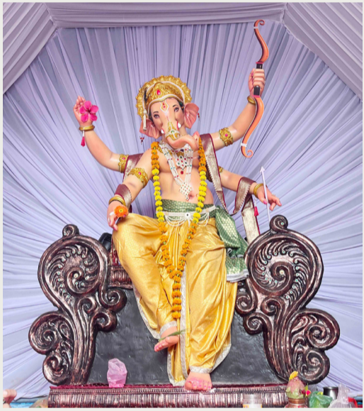
समसर्गणी प्रतिष्ठान राजा डोणगाव