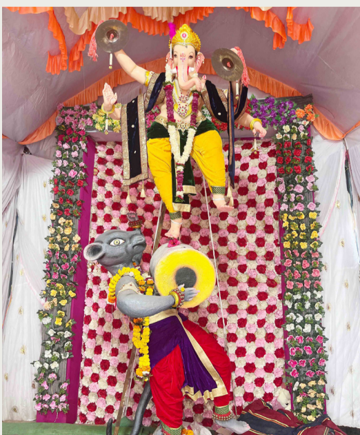
जय श्रीराम मित्र मंडळ डोणगाव

बुलडाणा/प्रतिनिधी: सन २०२५-२६ या वर्षाकरिता बुलडाणा जिल्हास्तरीय आकस्मिक पिण्याचे पाणी निश्चिती समितीची सभा पालकमंत्री व जिल्हाधिकारी यांच्या प्रमुख उपस्थितीत दिनांक ५ ऑक्टोबर ते १५ ऑक्टोबर २०२५ दरम्यान आयोजित करण्यात येणार आहे. जिल्ह्यातील विविध पाटबंधारे प्रकल्पांवरून पिण्याचे पाणी आरक्षणाबाबत मागणी सादर करण्यासाठी सर्व नगरपरिषदा, महाराष्ट्र जीवन प्राधिकरण, पंचायत समित्या तसेच संबंधित ग्रामपंचायतींनी आपली मागणी २५ सप्टेंबर २०२५ पूर्वी न चुकता कार्यकारी अभियंता, बुलडाणा पाटबंधारे विभाग, बुलडाणा यांच्याकडे सादर करावे, असे आवाहन करण्यात आले आहे. सदर सभेत प्रकल्पांमधील उपलब्ध पाणी साठ्याचा आढावा घेऊन पिण्याच्या पाण्याच्या आरक्षणास मंजुरी देण्यात येणार आहे. त्यामुळे सर्व संबंधित बिगर सिंचन आरक्षण करणाऱ्या संस्थांनी याची नोंद घ्यावी, असे कार्यकारी अभियंता, बुलडाणा पाटबंधारे विभाग यांनी कळविले आहे.