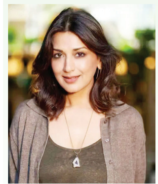
जमिनीच्या वादातून अभिनेत्री सोनाली बेंद्रे अडचणीत

■ बुलढाणा ■ वाशिम ■ यवतमाळ ■ अमरावती ■ वर्धा ■ नागपूर ■ गोंदिया ■ भंडारा ■ चंद्रपूर ■ गडचिरोली ■ छत्रपती संभाजीनगर ■ मुंबई